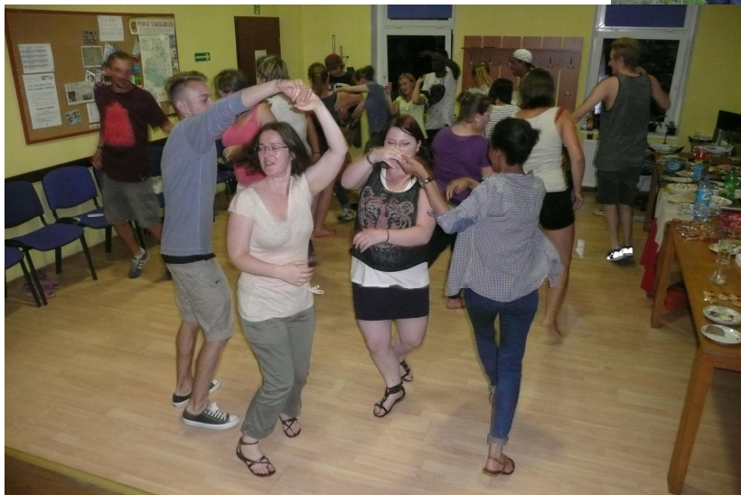
good bye evening