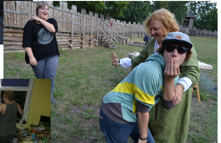
visit in Owidz