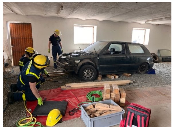
Fachtechnisches Training (FTT)

Durch das FTT sind sie in der Lage, die richtigen Werkzeuge und Rettungsmittel auszuwählen und sicher anzuwenden.