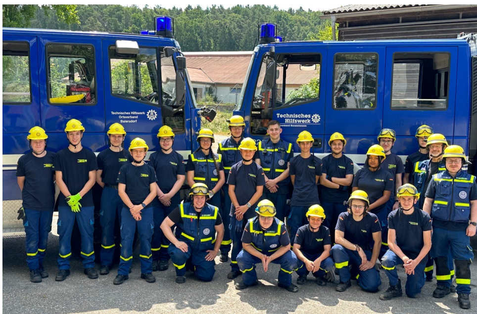
Gruppenbild Fachtechnisches Training (FTT)

Fachtechnisches Training (FTT) für Mittelfränkische Nachwuchs-THW'ler auf Burg Hoheneck