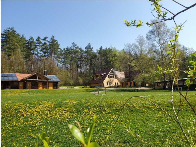
Außenbereich Versorgungshaus, Jugendhaus und Grillhalle durch Weidendom

Der Deckersberg ruft! Wir haben ab Oktober noch ein paar freie Termine im Jugendübernachtungshaus und auf dem Zeltplatz. Details zu Preisen und Verfügbarkeiten gibt es unter www.die-edelweisshuette.de oder direkt über eine Anfrage per Mail an die-edelweisshuette@nuernberger-land.de .