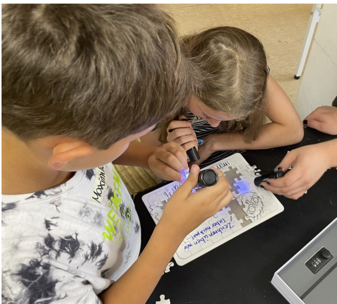
KJR Roth Medienmobil

Das Medienmobil unterstreicht die Wichtigkeit medienpädagogischer Projekte und schon jetzt können wir uns auf das kommende Jahr freuen, wenn es erneut auf Tour geht.