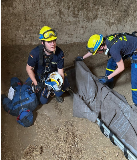
Fachtechnisches Training (FTT)

Im THW kann man bereits ab 6 Jahren mitmachen, in der Jugendorganisation der Bundesanstalt Technisches Hilfswerk erste Erfahrungen im Bereich der technischen Hilfeleistung sowie Arbeiten im Team sammeln.