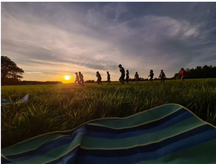
Tanzen im Sonnenuntergang

kunde oder beim Klettern konnten die Teilnehmer*innen ihr Wissen in Sachen „Survival“ erweitern. Eines der Highlights war sicherlich das große Lagerfeuer, bei dem die Teilnehmer*innen gelernt haben, auf alternative Arten Feuer zu machen und welche Blättersorten am besten brennen sowie das gemeinsame Tanzen im Sonnenuntergang.