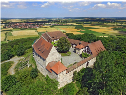
Die Burg Hoheneck

Telefon +49 (9846) 9717-0 oder Mail info@burg-hoheneck.de .