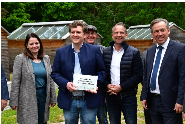
Überreichung staatliche Anerkennung Umweltstation