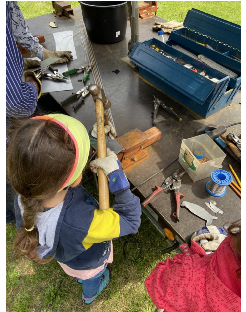
Kinderkundschafter Projekt „KiKU“