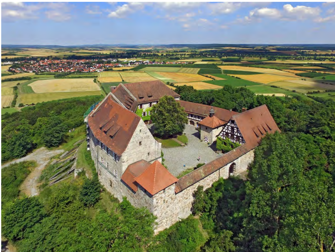
Die Burg Hoheneck aus der Vogelperspektive

Telefon +49 (9846) 9717-0 oder Mail info@burg-hoheneck.de .