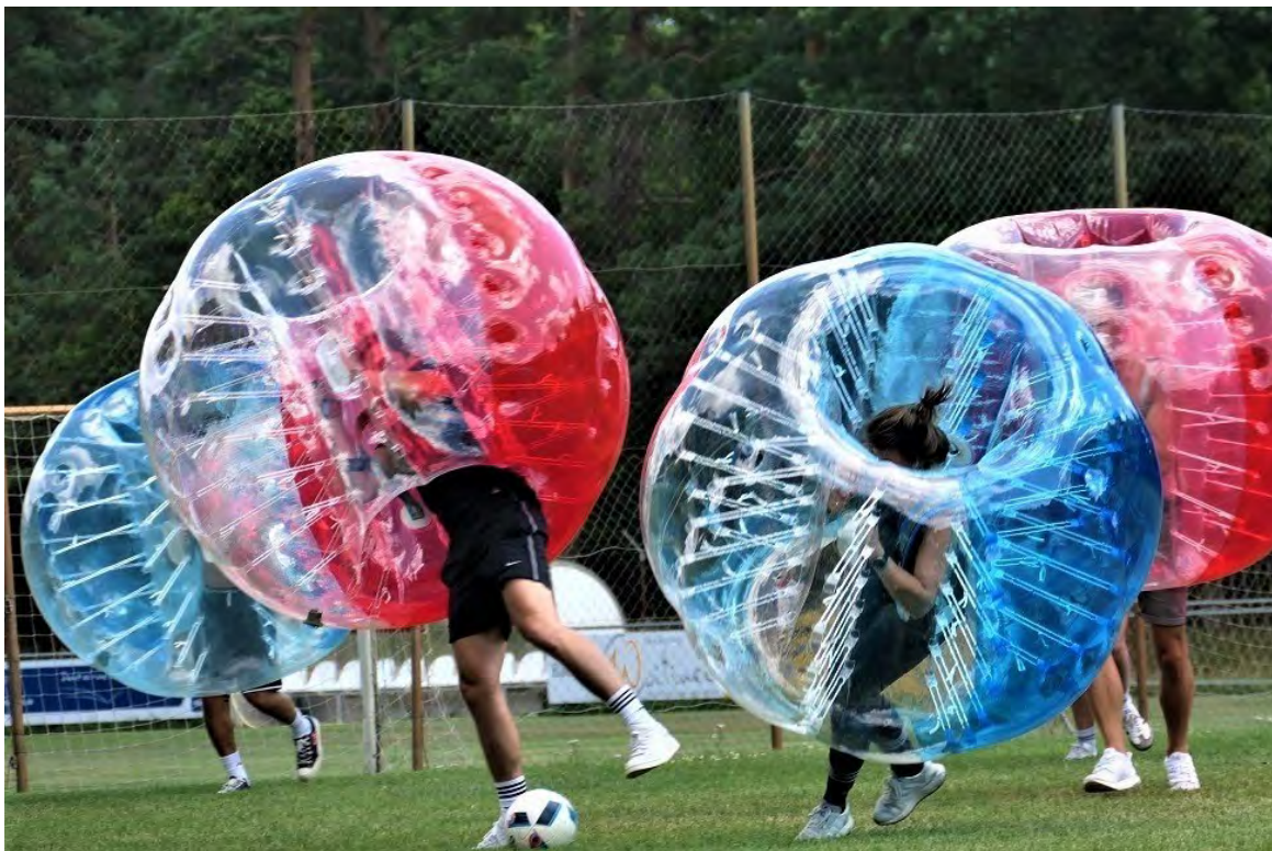
Bubble-Soccer beim Ehrenamtsdank in Burgorberbach

Unser traditioneller Ehrenamtsdank – ursprünglich Ehrenamtskino – fand am 21.05.2023 zum zweiten Mal in Burgoberbach statt und war ein voller Erfolg. Mit strahlendem Sonnenschein hatten wir die idealen Bedingungen um uns beim Bubble Soccer, mit Ice-Breaker-Spielen und Fussball-Darts besser kennenzulernen. Für die Verköstigung sorgte dieses Jahr die Metzgerei Hetzel aus Dombühl deren (u.a. vegane) Würstchen hoch gelobt wurden. Auch abgesehen von der Verpflegung herrschte ein ausgelassenes Miteinander und wir als KJR Vorstand-schaft & Geschäftsstelle haben es sehr genossen unsere Ehrenamtlichen im Landkreis etwas verwöhnen & besser kennenlernen zu dürfen. Wir freuen uns bereits auf nächstes Jahr!