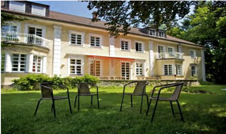
Das Institut Gauting Außenansicht