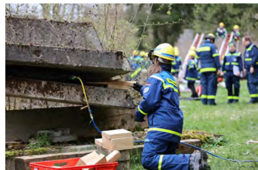
Bezirksübung der THW-Jugend in Langlau am Brombachsee