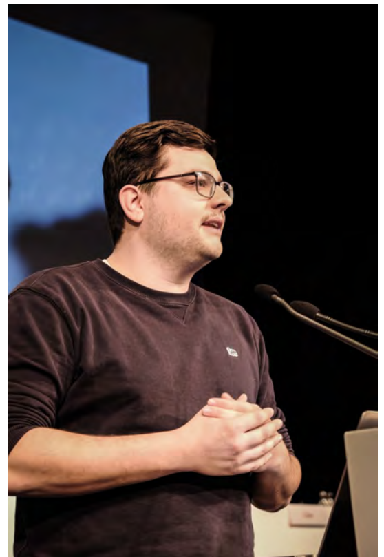
Autorenbild während der Vote16 Klausur

Oft maßen sich Akteure im politischen Diskurs an, für die Jugend zu sprechen, zu wissen, was ihnen wichtig ist und Politik mit ihnen für sie zu machen. Wir haben es uns zur Aufgabe gemacht, dass junge Menschen im wahrsten Sinne des Wortes eine Stimme bekommen und bei Wahlen ihr Kreuz auf dem Wahlzettel in Bayern abgeben dürfen. Wir sind der festen Überzeugung, dass junge Menschen reif und politisch genug sind, um die Tragweite des Wahlrechts zu begreifen und dieses verantwortungsvoll auszuüben. Frühzeitige Partizipation stellt zudem sicher, dass junge Menschen auch perspektivisch an demokratische und politische Prozesse gebunden werden: Je früher Menschen Wähler werden, desto wahrscheinlicher ist es, dass sie es auch bleiben!