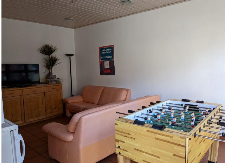
Gemeinschaftsraum im Jugendtreff Ammerndorf