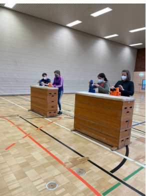
BDS-Coaches bei der Ausbildung

zu den motorischen Grundfertigkeiten Kraft, Ausdauer, Schnelligkeit, Koordination und Beweglichkeit beinhalten. Zu jeder motorischen Fertigkeit wurde eine Unterrichtsstunde erstellt. Diese Stunden können von den Übungsleitern*innen der Vereine und Lehrkräften gehalten werden und erfordern keine weitere Vorbereitung mehr. Zudem beinhalten alle Stunden spezielle Übungen (z.B. Fingerübungen) welche Kognitives mit koordinativen Übungen verbinden und so Geist und Bewegung ansprechen und deren Zusammenwirken schulen.