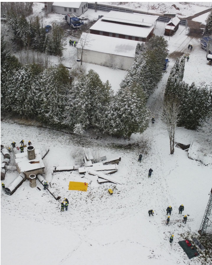
Während der „traditionellen“ Bezirksübung in Langlau

Kinder und Jugendliche aus allen mittelfränkischen Jugendgruppen sind dazu eingeladen, ihr erlerntes Wissen um die Rettung von Personen, Verletzentransport, Anwenden von THW-Ausstattung an möglichst realistischen Übungsobjekten/ Szenarien zu üben. Coronabedingt musste diese Veranstaltung zwei Jahre pausiert werden – aber Anfang April 2022 war es endlich wieder soweit!