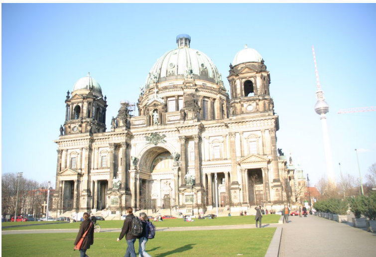
Brandenburger Tor in Berlin

Wir fahren nach Berlin! Zum ersten Mal seit Ewigkeiten bietet der KJR wieder eine