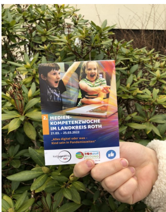
Medienkompetenzwoche im Landkreis Roth

Im Februar 2020 veranstaltete der Kreisjugendring Roth gemeinsam mit der Bildungsregion Roth erstmalig die Medienkompetenzwoche.