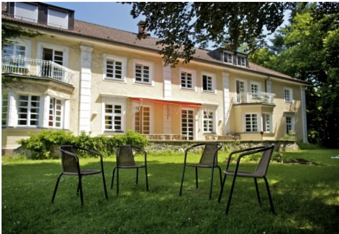
Das Institut Gauting von außen