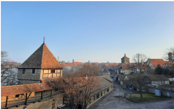
juleica-Schulung in Rothenburg ob der Tauber

Unsere diesjährige Juleica Schulung fand vom 18. – 20.03.22 in Rothenburg ob der Tauber statt.