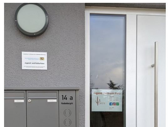
Eingang des Jugendzentrum HERZ