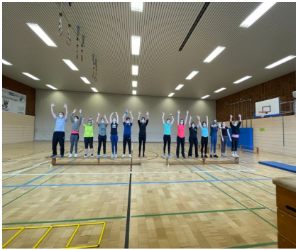
BDS-Coaches bei der Ausbildung

Die Bayerische Sportjugend hat ein neues Projekt mit dem Titel „Beweg dich schlau“ in Kooperation mit der Felix Neureuther Stiftung gestartet. Diese Aktion will dem Bewegungsmangel unserer Kinder und Jugendlichen, der durch die Corona-Krise noch verstärkt wurde, entgegenwirken. Mit der TU München wurden Unterrichtsstunden für den Grundschulbereich ausgearbeitet, welche gezielte Bewegungsübungen