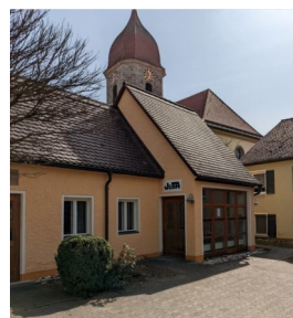
JuTA von außen