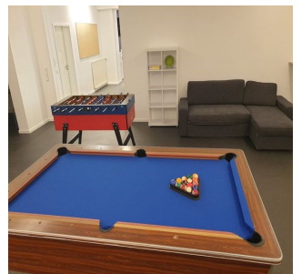
Billardtisch im Jugend- treff Veitsbronn

Der neue Treff befindet sich im Süd-Trakt der ehemaligen Mittelschule Veitsbronn direkt unter dem FabLab. Die Öffnungszeiten und alle weiteren Infos zu Aktionen, Angeboten und Veranstaltungen findet ihr auf unserer Homepage www.jugendarbeit.veitsbronn.de . Ein echtes Highlight ist der neue Außenbereich des Treffs.