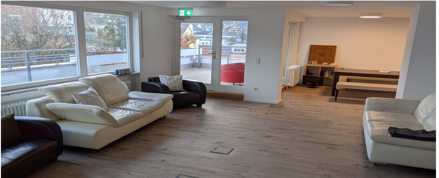
Gemeinschaftsraum im Jugendzentrum HERZ in Cadolzburg

Das „Herz“ ist das Jugendzentrum des Markt Cadolzburg. Es wird betrieben vom Team der Jugendpflege Süd und den Ehrenamtlichen des JugendForum Cadolzburg. Während unserer Öffnungszeiten des „Offenen Treffs“ ist jede*r herzlich willkommen! Neben der Möglichkeit, sich zu treffen und neue Leute kennenzulernen, stehen ein „Kicker“, diverse Brettspiele, Konsolen und eine Musikanlage zur Verfügung. Zusätzlich gibt es im Treff immer wieder besondere Angebote. Mehr auf Facebook (@jugendpflegsued), Instagram (@juzherz) und/oder im WhatsApp-Status (0160-1580300)